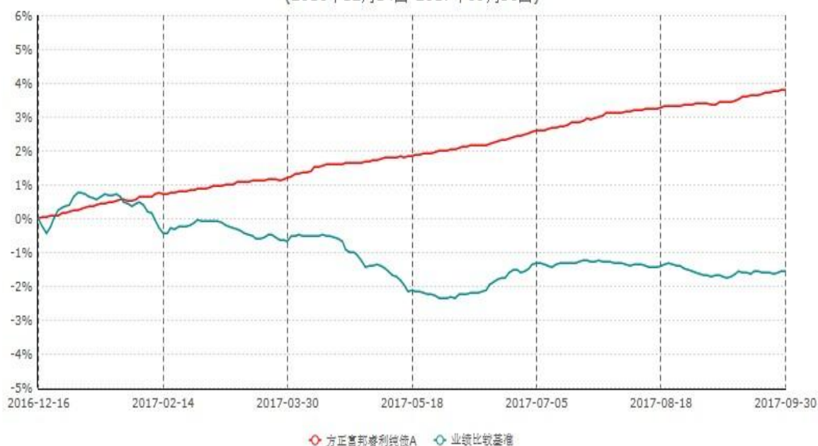
方正富邦睿利纯债A份额累计净值增长率与业绩比较基准收益率历史走势对比图 (2016年12月14日-2017年09月30日)