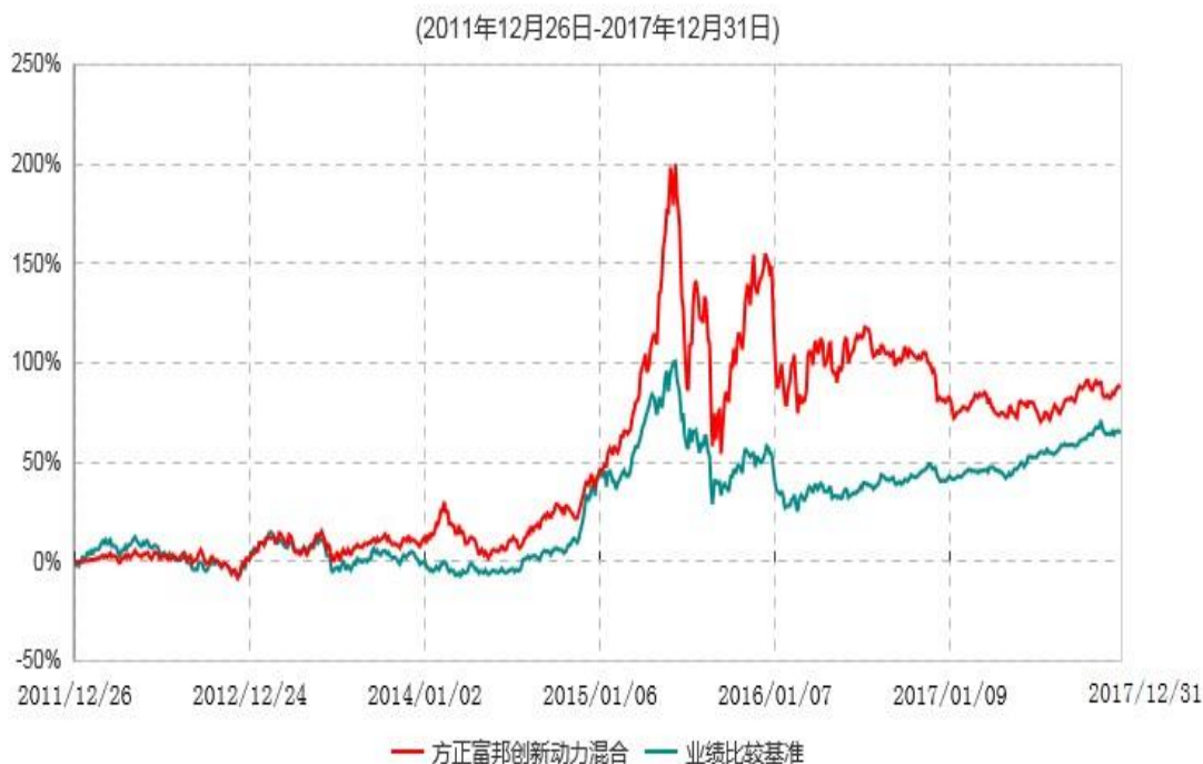
方正富邦创新动力混合型证券投资基金累计净值增长率与业绩比较基准收益率历史走势对比图