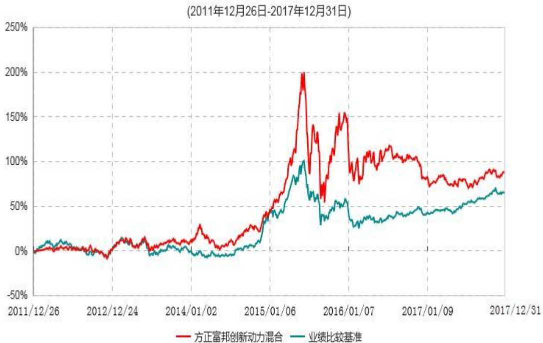
方正富邦创新动力混合型证券投资基金累计净值增长率与业绩比较基准收益率历史走势对比图