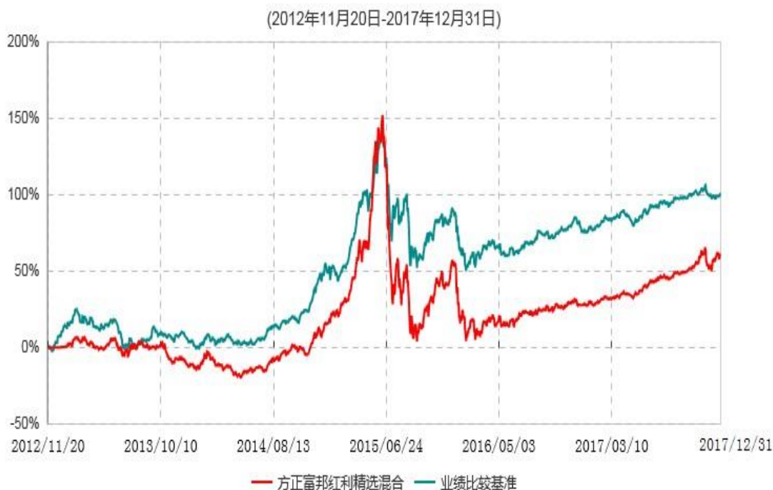
方正富邦红利精选混合型证券投资基金累计净值增长率与业绩比较基准收益率历史走势对比图