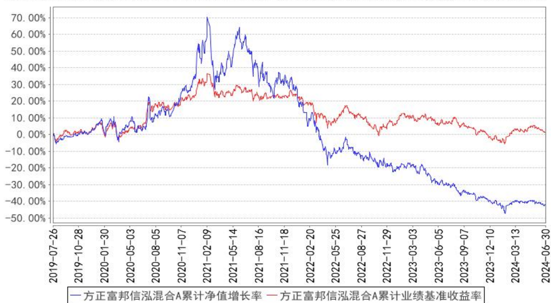
方正富邦信泓混合A累计净值增长率与同期业绩比较基准收益率的历史走势对比图