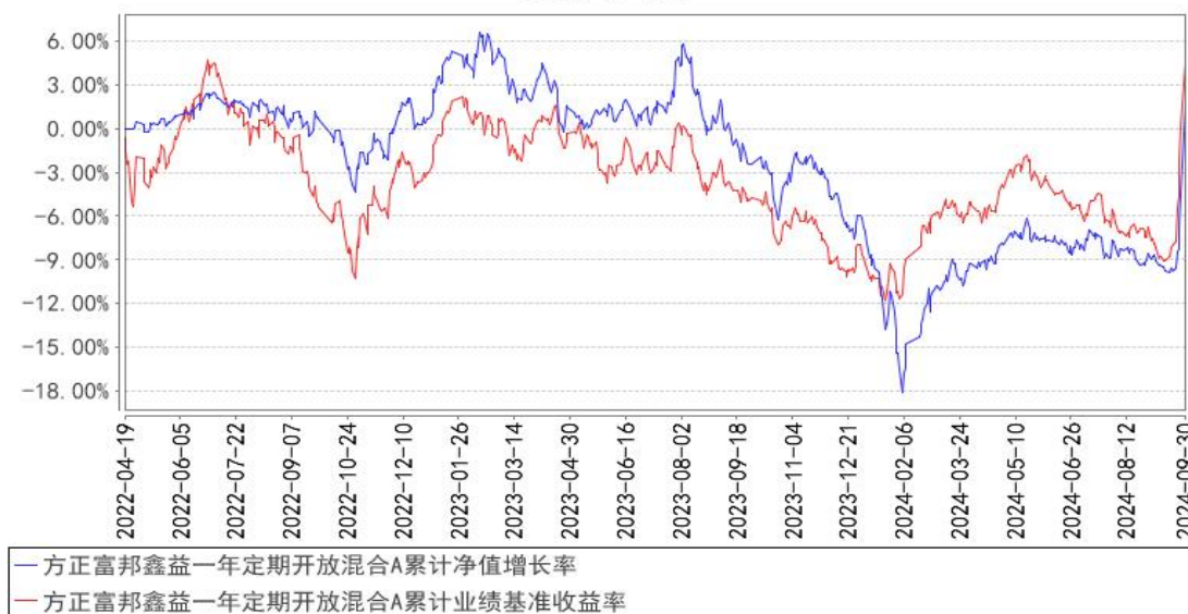
方正富邦鑫益一年定期开放混合A累计净值增长率与同期业绩比较基准收益率的历史走势对比图