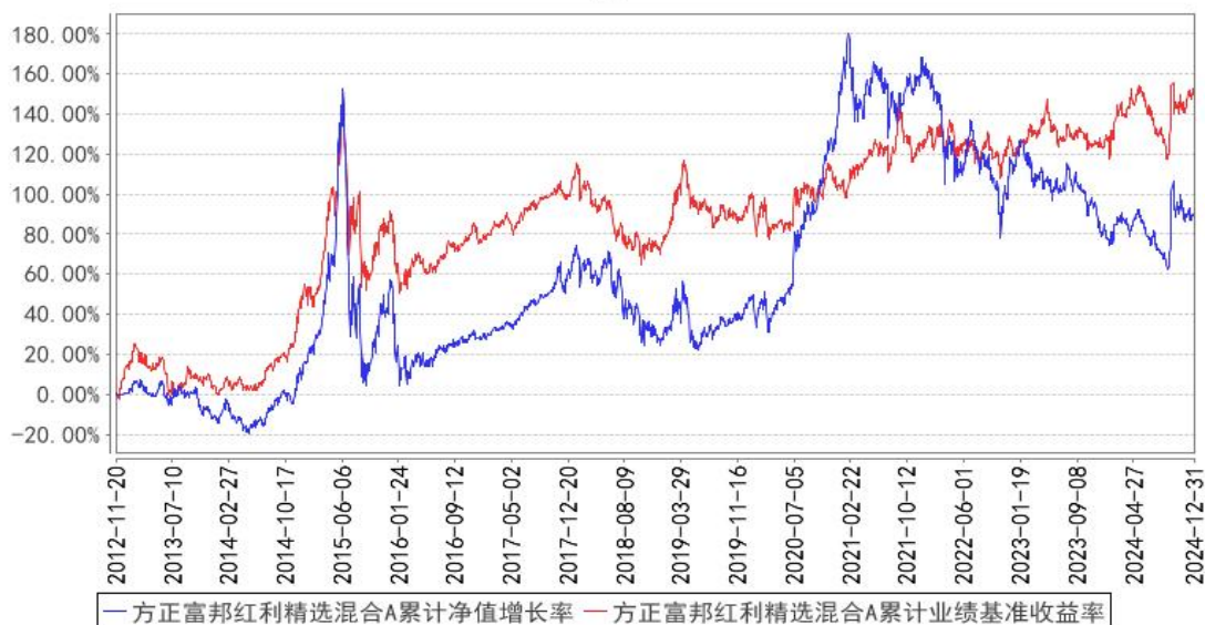
方正富邦红利精选混合A累计净值增长率与同期业绩比较基准收益率的历史走势对比图