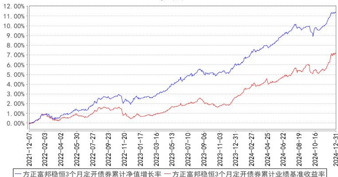
方正富邦稳恒3个月定开债券累计净值增长率与同期业绩比较基准收益率的历史走势对比图